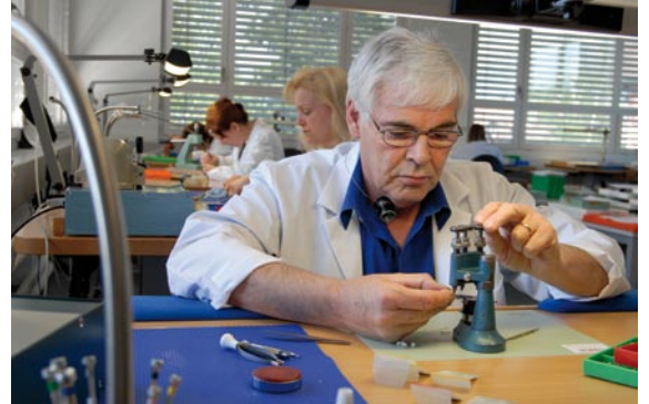
Die COVER Uhrmacher bei der Arbeit.

Der Produktionsstandort Schweiz ist für COVER ideal. Das Land bietet dem Unternehmen die besten Bedingungen für erstklassige Erzeugnisse. Zum Beispiel dank hervorragenden Spezialisten der Uhrenbranche und einem verlässlichen Netzwerk an Fachkräften. Diese Kriterien sind entscheidend. «Wir sind unabhängig, konkurrenzfähig und leben eine starke Geschäftskultur», erklärt die Schweizer Firmenleitung.