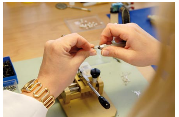
Tige anpassen und Krone montieren.