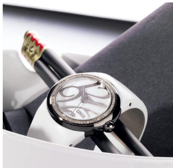
COVER Co95, Damenuhr, Edelstahl schwarz plaquiert, Swarovski Steine, Lederband.

Die Marke COVER ist eine Manifestation der Lebenslust.