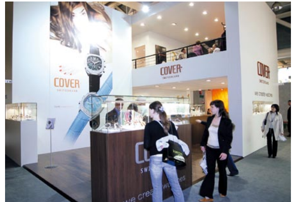
Der COVER Stand an der Weltmesse für Uhren und Schmuck «Baselworld» in Basel/Schweiz.

Mit Claudia Lässer konnte eine der bekanntesten und beliebtesten TV-Moderatorinnen der Schweiz engagiert werden. Ihre hohe Modekompetenz ist ein Gewinn für das Unternehmen. Als schöne Powerfrau transportiert Claudia Lässer auf ideale Weise die Botschaft von COVER: Modische Uhren, die Trends setzen – mit einem betörenden Anteil an Sinnlichkeit.