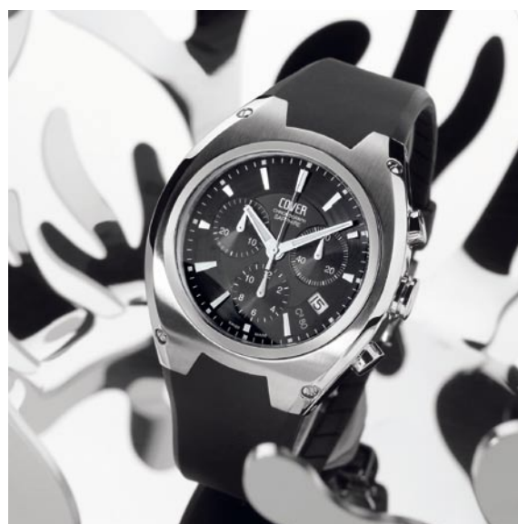
COVER Co80, Herren Chronograph, Edelstahl, Saphirglas, 100 Meter wasserdicht, Kautschukband.