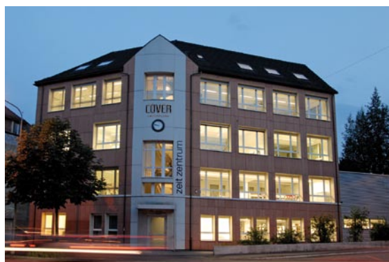
Das COVER Produktionszentrum heute.