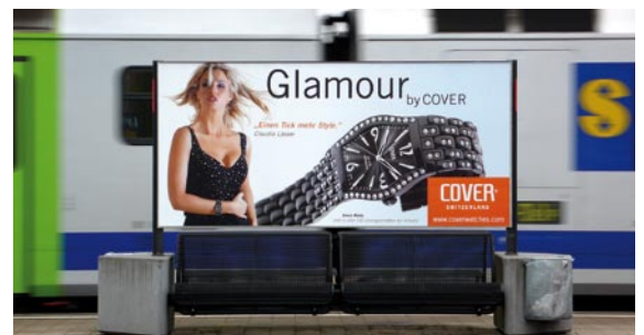
Plakataushang in der ganzen Schweiz.