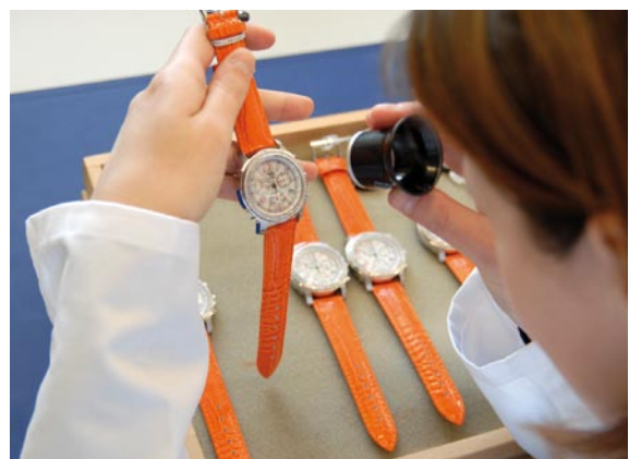
Endkontrolle vor der Auslieferung.